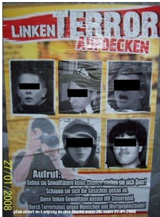
In Leipzig-Reudnitz und Connewitz angebrachtes Plakat.

Die Stadt Leipzig ist ein deutliches Beispiel für die Auflösung „klassischer“ Kameradschaftsstrukturen und die Herausbildung des „Freien Widerstandes“, der hier unter der Bezeichnung „Freie Kräfte Leipzig“ auftritt. Noch im Jahr 2006 waren vier aktive Kameradschaften bekannt; seit Anfang 2008 tritt keine Kameradschaft mehr öffentlich in